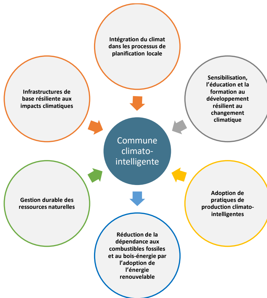
Figure 2: Axes stratégiques de commune climato-intelligente

Le PCAC de la commune Tchaoudjo 4 a été développé autour des axes stratégiques suivant :